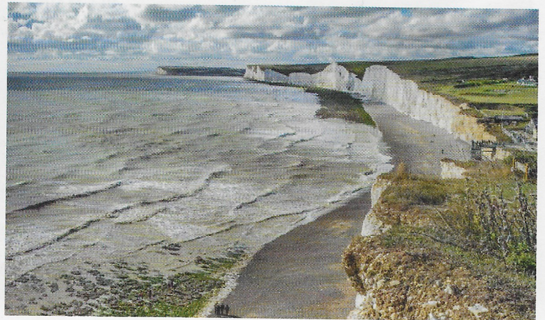
b. Le Seven Sisters: le scogliere di gesso, a ovest di Dover, affacciate al Canale della Manica.