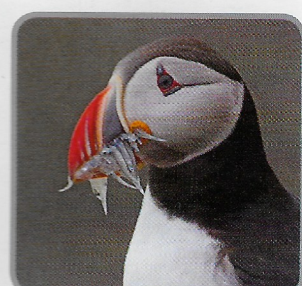
La pulcinella di mare