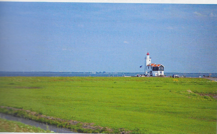
c. La penisola di Marken affacciata sul lago IJsselmeer, nei Paesi Bassi.