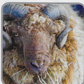
La pecora Shetland