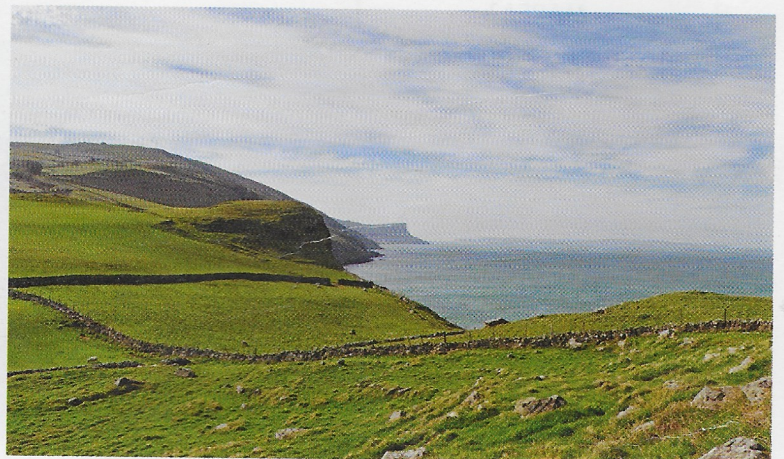
d. La costa settentrionale della Contea di Antrim, in Irlanda del Nord.