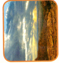
Il tempo nuvoloso