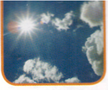
Il sole / Il tempo so